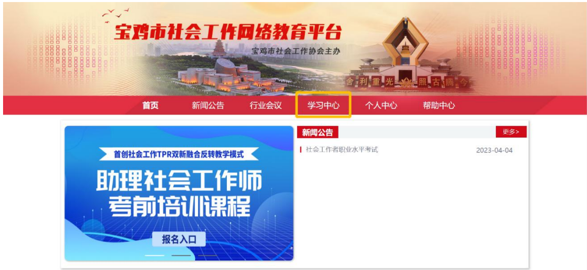
宝鸡市社会工作网络教育平台官网首页