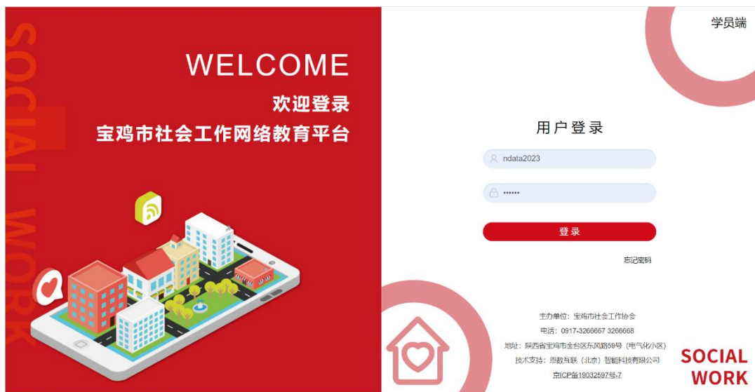
电脑端课程平台登录页面